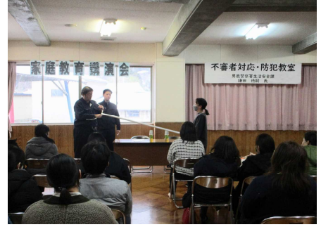
家庭教育講演会「不審者対応・防犯教室」